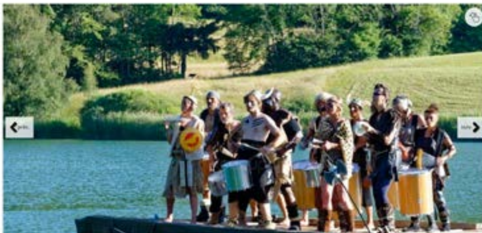
Le radeau chargé de percussionnistes approchait de la plage. Le deuxième festival "Festifoin" sur les hauteurs du lac.

Près de 2000 personnes sont venues à la Thuille samedi, pour la 2e édition de "Festifoin". Le festival a attiré des familles, des jeunes et moins jeunes, en proposant des spectacles variés sur deux scènes. L'une, au bord du lac, réservait une jolie surprise : un radeau chargé de Vikings est venu par les eaux avec un groupe de Fatelier de percussions du plateau de la Leyse, « les percutés ». La suite du festival se déroulait vers la salle des fêtes avec une scène en plein champ. La soirée laissait la place à différents groupes locaux : Zilena, les Lampes à huiles, Ricky James Père et Fils. Une création, « Faits d'hiver », spectacle pyrotechnique, spécialement créé pour Festifoin 2, impressionna le public. La soirée se termina en toute tranquillité avec Palaka, groupe de reggae à contre-courant. Cette 2e édition fut une réussite grâce à la cinquantaine de bénévoles ; le village fut quelque peu envahi par une marée de voitures, mais le lendemain ce lieu qui se prête si bien à des festivités, retrouvait tout son calme.