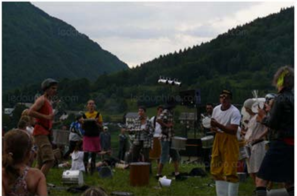
Lors du 1er festival "Festifoin" : le groupe des "Percutés". Lors du 1er festival "Festifoin" : le groupe des "Percutés".